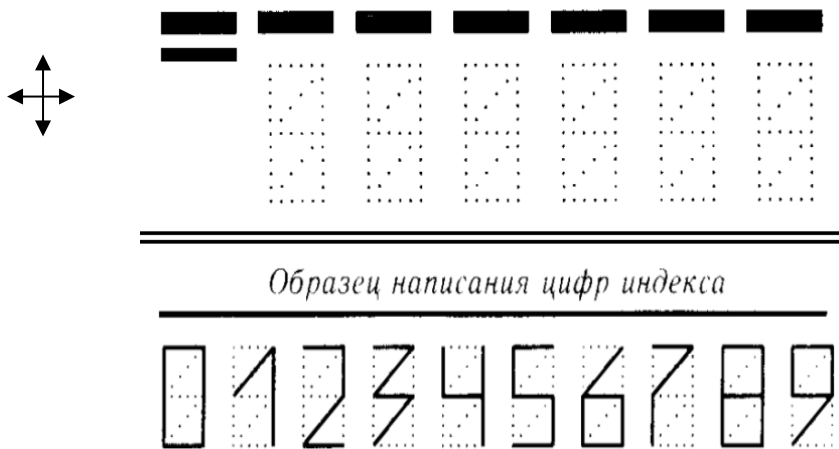
Образец написания цифр индекса

ЗАДАНИЕ: В настоящее время на почтовых конвертах печатают специальную разграфку, в которой отправитель должен написать особым шрифтом цифровой индекс почтового отделения. Примем верх конверта за северное направление, как это принято на географических картах. В этом случае линии, образующие цифры, могут идти по азимутам: