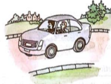
c) Mr Black